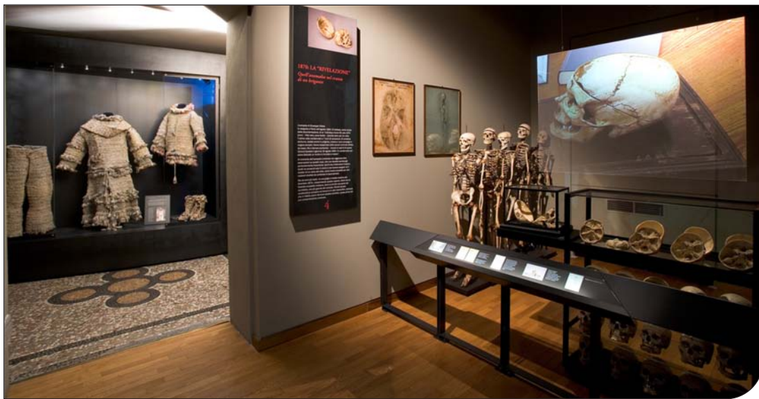
Fig. 3. Museo di antropologia criminale "Cesare Lombroso". Sala 4 "1870: la rivelazione"

"Cesare Lombroso" Museum of Criminal Anthropology. Room 4 - 1870: the "revelation"