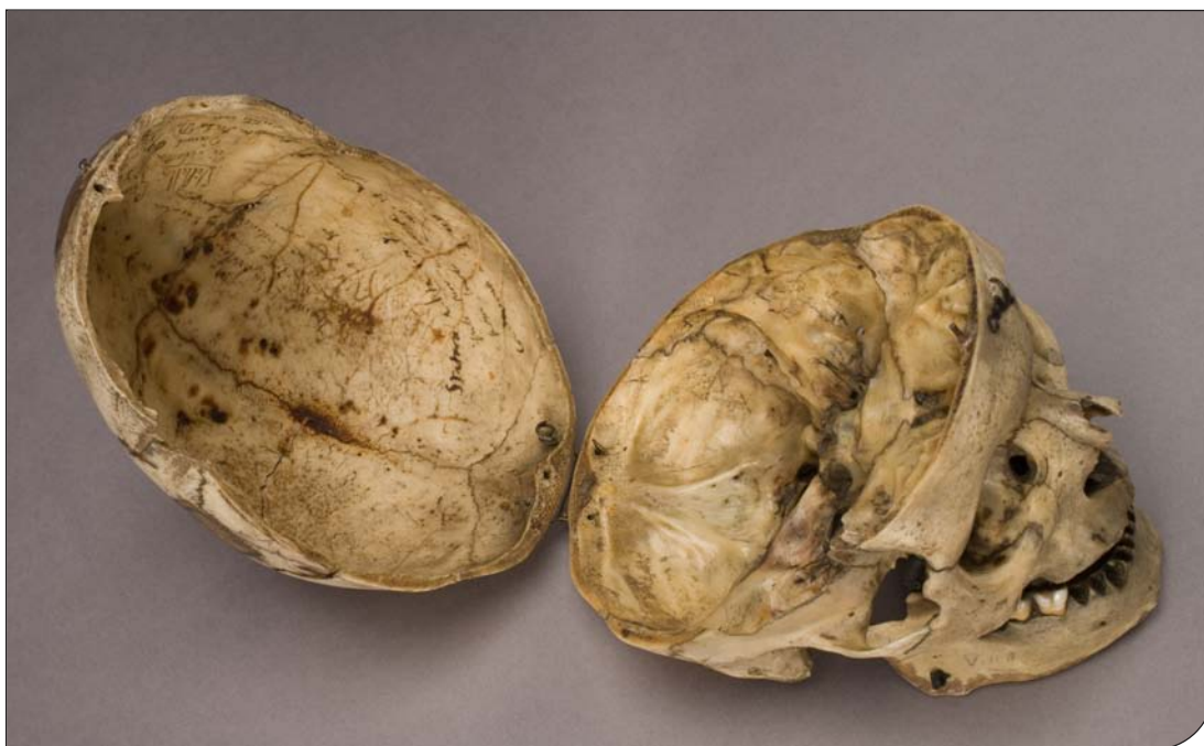
Fig. 2. Museo di antropologia criminale "Cesare Lombroso". Interno della teca ossea.

"Cesare Lombroso" Museum of Criminal Anthropology. Interior of the braincase.