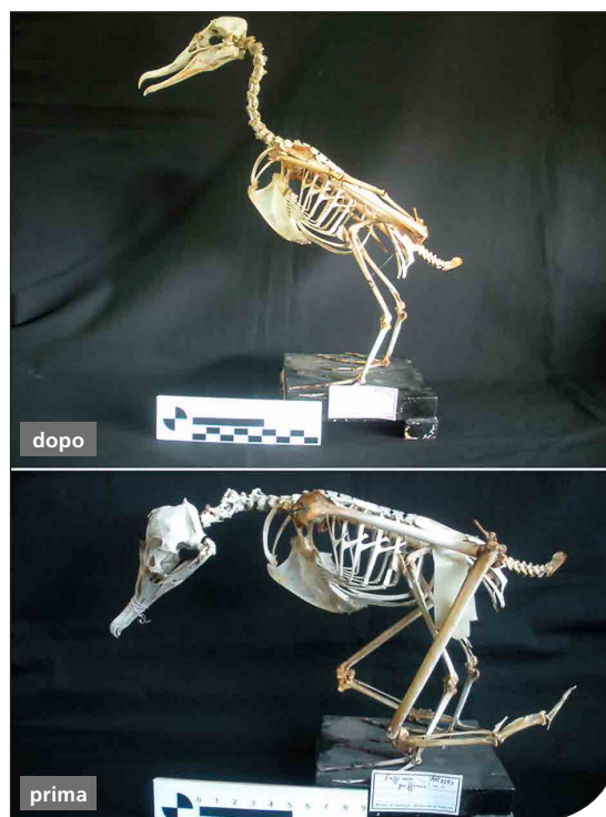
Fig. 2. Apparato scheletrico di berta minore (AN-1253 Puffinus puffinus ) prima e dopo l'intervento di restauro.