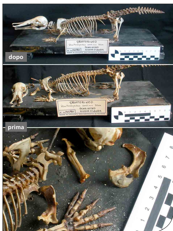
Fig. 3. Apparato scheletrico di ornitorinco (AN-861 Ornithorhynchus anatinus ) prima e dopo l'intervento di restauro.

In un caso specifico si è proceduto alla costruzione ex novo di una vertebra completamente assente. L'apparato scheletrico AN-1206 ( Canis familiaris ) si presentava sprovvisto della prima vertebra cervicale – l'atlante; vista l'importanza di questo osso, dal punto di vista sia scientifico che estetico, si è proceduto alla costruzione tramite materiali sintetici di una nuova vertebra cervicale. Con l'utilizzo di una stampante 3D, si è avuta la possibilità di restaurare il pezzo tramite l'utilizzo di materiale sintetico quale ABS (acrilonitrile-butadiene-stirene). L'ABS è un comune polimero termoplastico utilizzato per creare oggetti leggeri e rigidi, si presenta sotto forma di filo in una bobina in svariati colori; per le nostre esigenze si è preferito adottare un colore neutro, il bianco. Tramite il calibro a branche dritte si sono potute ottenere delle misurazioni dai punti repere (punti che vengono