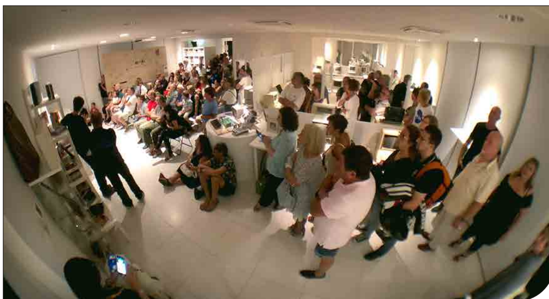
Fig. 3. Un momento della notte al museo.

2) Associazione Stellaria http://www.astroperinaldo.it/