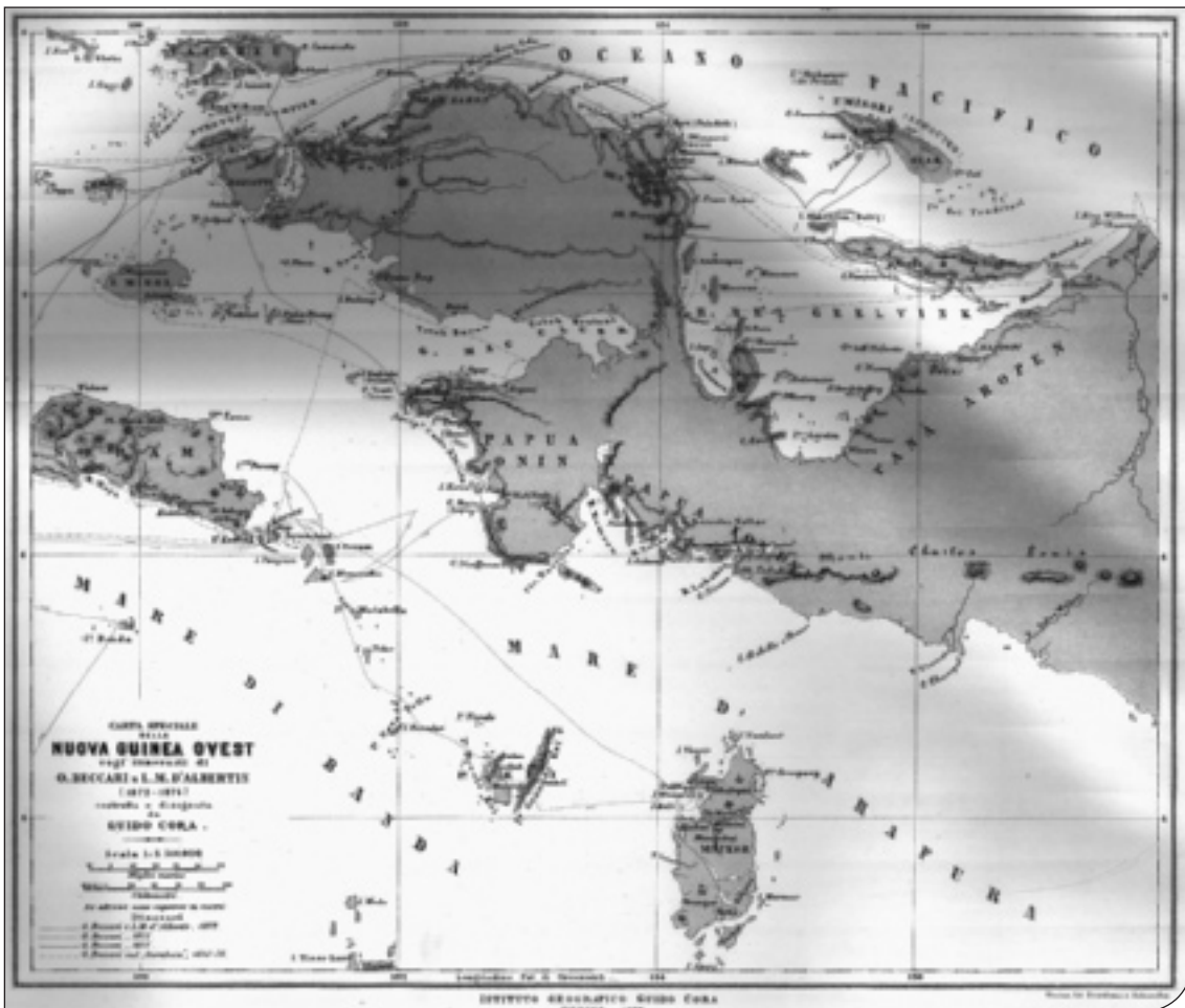
Fig. 2. Mappa degli itinerari seguiti da O. Beccari nei suoi viaggi in Indonesia e Nuova Guinea.

sulle collezioni di Uccelli del Paradiso e Uccelli Giardinieri e sul naturalista fiorentino Odoardo Beccari (fig. 1), le cui spedizioni (fig. 2) hanno avuto il merito di arricchire i Musei fiorentini di Botanica, Zoologia e Antropologia di una straordinaria mole di reperti, provenienti soprattutto dalla Nuova Guinea e dall'Indonesia, di importanza unica per la scienza.