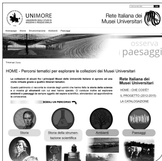
Fig. 1. Homepage del portale della rete dei musei universitari.

effettuata sia dal punto di vista storico che da quello territoriale grazie a numerosi itinerari che i diversi Musei Universitari hanno elaborato per il portale web della rete (online da ottobre 2016) nell'ambito di quattro percorsi tematici dedicati ad ambienti, a paesaggi, storia della strumentazione scientifica e storie (figg. 1-2), inserendo in queste ultime, attraverso le figure dei più illustri docenti, le ricerche che hanno caratterizzato ciascuna Università, oltre alle storie della loro nascita e sviluppo (Corradini, 2015a: v. sito web 2). I numerosi itinerari hanno consentito di creare nuove relazioni, di raccontare le articolate storie delle collezioni, di creare nuovi interessi attorno ad esse e conseguentemente di incrementare il potenziale educativo dei musei (Adam et al., 2003).