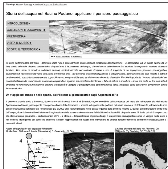
Fig. 3. Pagina iniziale di uno dei percorsi del portale della Rete dei Musei Universitari Italiani dedicato al paesaggio.

Questi percorsi di apprendimento informale e non formale, a diretto contatto con gli strumenti della ricerca e attraverso l'uso di tecnologie e strumenti informatici stimoleranno gli studenti ad apprendere, a sviluppare conoscenze, a condividere informazioni con genitori e famiglie oltre che con tutor scolastici e insegnanti (O'Neill & Dufresne-Tassé, 2012; Xanthoudaki, 2013). Per favorire la condivisione di esperienze e conoscenze sono stati previsti cicli di incontri, seminari, tavole rotonde (Rubiales Garcia Jurado, 2012). Le attività previste dal progetto sono supportate da mediatori culturali (Friedman & Mappen, 2011) che, dopo una specifica formazione effettuata dai responsabili dei Musei Universitari e dai docenti delle varie discipline, collaboreranno attivamente con gli stessi, predisporranno i materiali necessari per i percorsi sia su supporto informatico che cartaceo (Kelly, 2014), organizzeranno le attività e si interfaceranno con gli studenti,