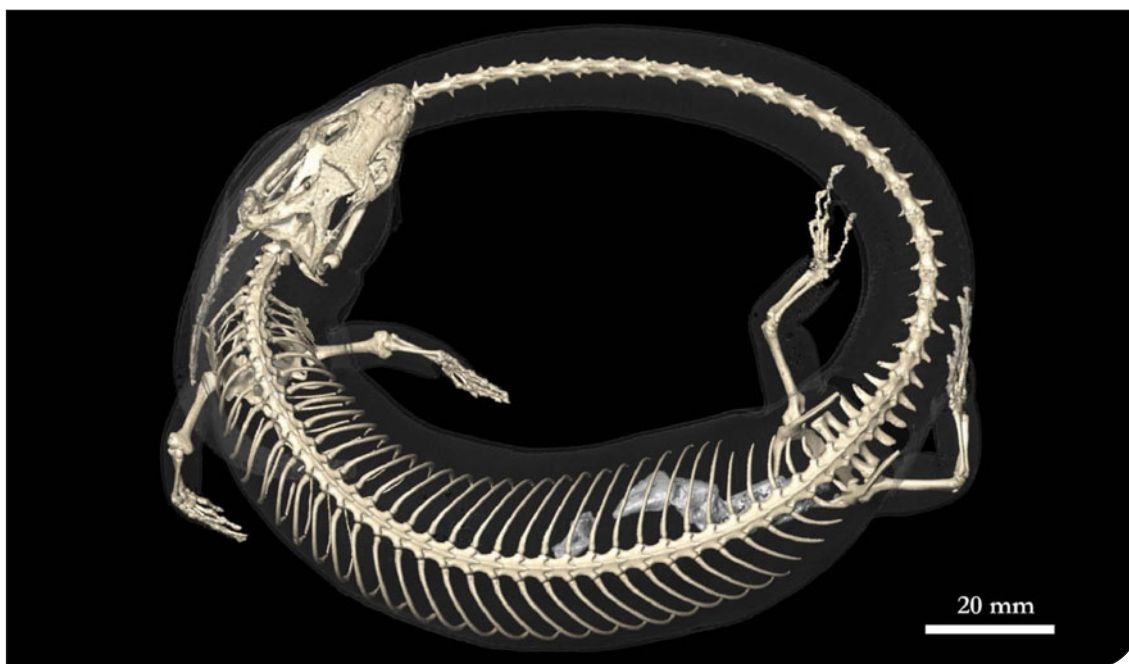
Fig. 1. Esempio di utilizzo di collezioni museologiche per analisi di aspetti morfologici ed ecologici. Scan 3D ottenuto con utilizzo di microtomografo a raggi X sull'esemplare MRSN R1720 di Amphiglossus reticulatus (Reptilia, Scincidae) proveniente dal Madagascar e conservato presso il Museo Regionale di Scienze Naturali di Torino. Oltre agli aspetti scheletrici e anatomici è possibile identificare resti di prede (crostacei) nel tratto intestinale.

hanno rapporti con la recente crisi economica nonché con la difficoltà da parte delle pubbliche amministrazioni locali e delle università (enti che gestiscono i musei naturalistici pubblici) di promuovere adeguatamente la componente di studio e di ricerca basata sulle collezioni, solitamente considerate quali elementi espositivi o didattici e meno frequentemente come strumento e base di raccolta dati scientifici.