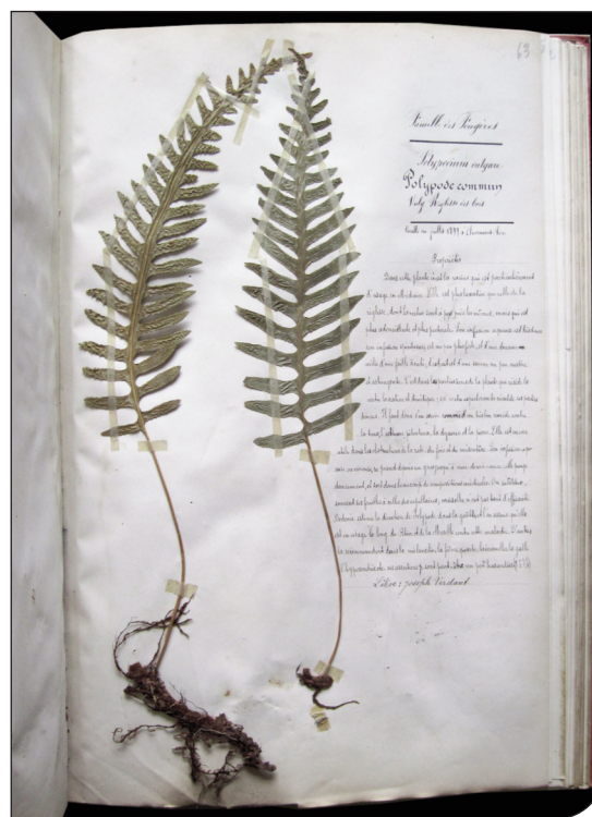
Fig. 1. Esemplare di felce.

L'acquisizione dell'immagine digitale di ogni esemplare è stata fondamentale per diversi motivi di ordine pratico e gestionale, poiché l'erbario è antico e i fogli sono legati tra loro a formare cinque volumi di grossa dimensione (tab. 1). L'utilizzo di una comune fotocamera digitale ha permesso di realizzare rapidamente una serie completa di immagini ad alta definizione, su cui è stato successivamente svolto tutto il lavoro di analisi dell'erbario e di integrazione del catalogo digitale.