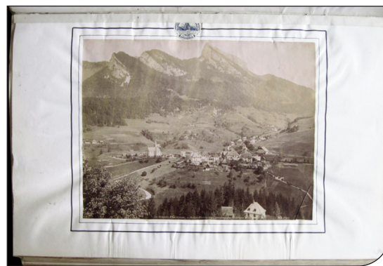
Fig. 2. Fotografia intercalata nel vol. 4.

L'erbario appare completo e nell'allestimento originale. È composto da 5 volumi con copertina in cartone rivestito di carta rossa e con dorso in cartone rivestito