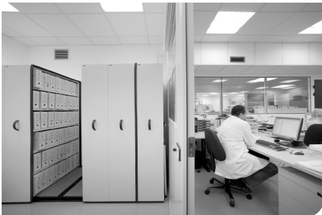
Fig. 1. Archivio compattabile - i componenti scorrono su binari e possono essere quindi avvicinati uno all'altro aprendo solo quello desiderato. Eliminando i percorsi multipli consente il raddoppio dello spazio di archiviazione nello stesso ambiente.

Ha concentrato le proprie energie e capacità nella progettazione, sviluppo e produzione di prodotti di altissima qualità in grado di cogliere, interpretare e assecondare la continua evoluzione delle esigenze produttive; ha brevettato il "passo Lista", utilizzato e riconosciuto da tutte le aziende come standard delle dimensioni dei cassetti industriali.