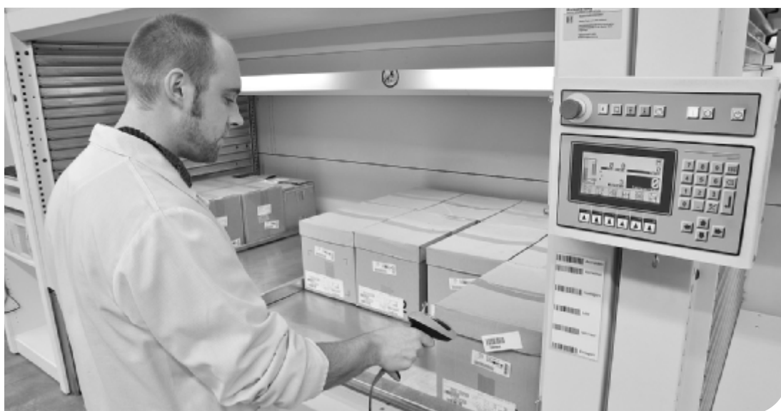
Fig. 3. Baia di prelievo di un magazzino automatico verticale - il sistema presenta all'operatore il vassoio contenente l'oggetto richiesto indicandone sul visore l'esatta posizione; la lettura del codice a barre registra il prelievo ed evita errori di identificazione.

Quali sono le situazioni ambientali (temperatura, umidità relativa, esposizione alla luce etc) necessarie alla