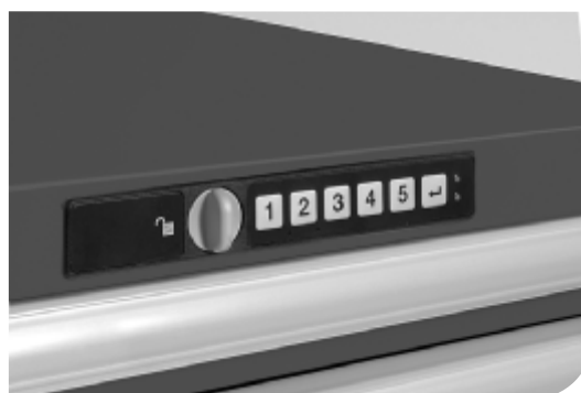
Fig. 5. Code Lock - applicato ad armadi

l'archiviazione di oggetti di varie dimensioni e peso suddividendo in modo personalizzato ogni singolo cassetto. I cassetti, cuore del sistema, possono portare, secondo le esigenze, 75 o 200 Kg, hanno guide ad estrazione totale e maniglie per una facile identificazione del contenuto.