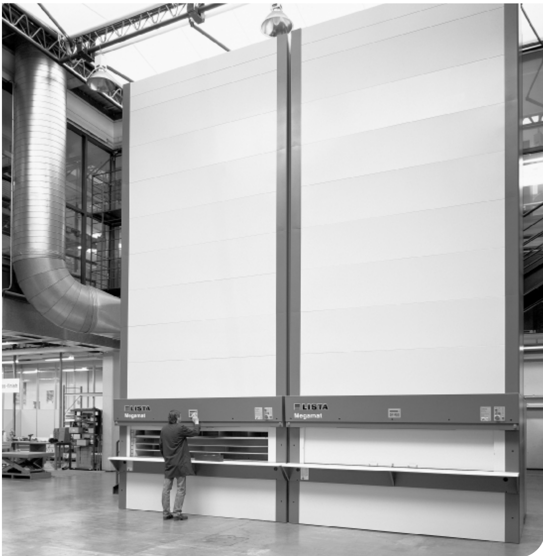
Fig. 2. Magazzino automatico verticale - strutturabile in funzione delle caratteristiche e delle quantità dei materiali da conservare e movimentare. Il software di gestione consente una immediata reperibilità di ogni articolo e, all'occorrenza, il mantenimento di condizioni di temperatura e umidità controllate.

Per questo Lista è leader mondiale nel settore industriale, ma la qualità, l'efficienza, l'ordine e la sicurezza sono valori che legano chiunque, nel proprio ambito, si ponga come obiettivo l'eccellenza.