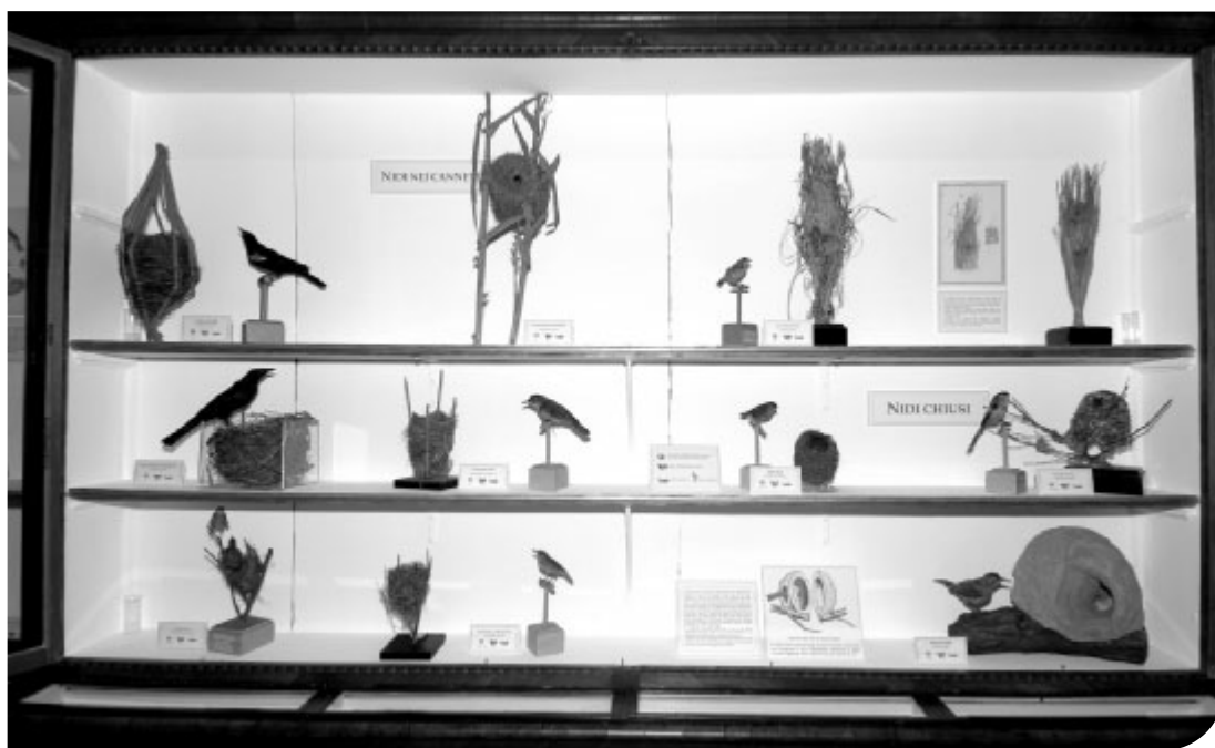
Fig. 1. La vetrina con i nidi chiusi e i nidi dei canneti.

Oltre all'utilizzo di materiale già presente nella vecchia esposizione, sono stati aggiunti nuovi esemplari appartenenti alla collezione del museo (per esempio le uova di Barbagianni e di Succiacapre, il nido di