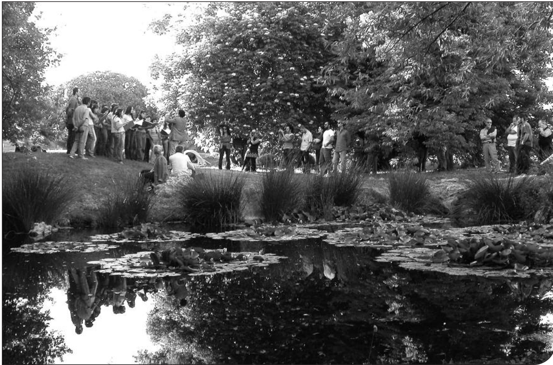
Fig. 2. Coro d'Ateneo "Ars Nova" durante un'esibizione all'Orto Botanico.

gono alcune specie presenti nell'Orto Botanico stesso. Durante la manifestazione sono stati organizzati convegni, tavole rotonde, visite guidate alle collezioni botaniche, concerti e performance di musica (fig. 2) e danza, attività di divulgazione ambientale con le scolaresche attraverso laboratori didattico-scientifici e creativi.