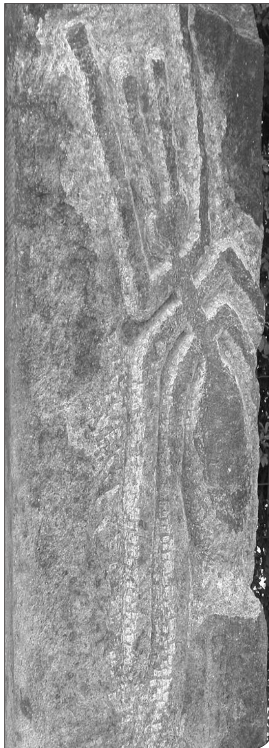
Fig. 1. Opera "Formiche 2070, 2008", scolpita su un monolite di peperino dall'artista Stefano Di Maulo.

testimonianze artistiche, realizzate utilizzando diversi materiali (fig. 1). Tra le mostre d'arte presenti nel 2008, una personale di pittura botanica: "La strada dell'Orto", con dipinti ad olio e acquarelli che ritrag-