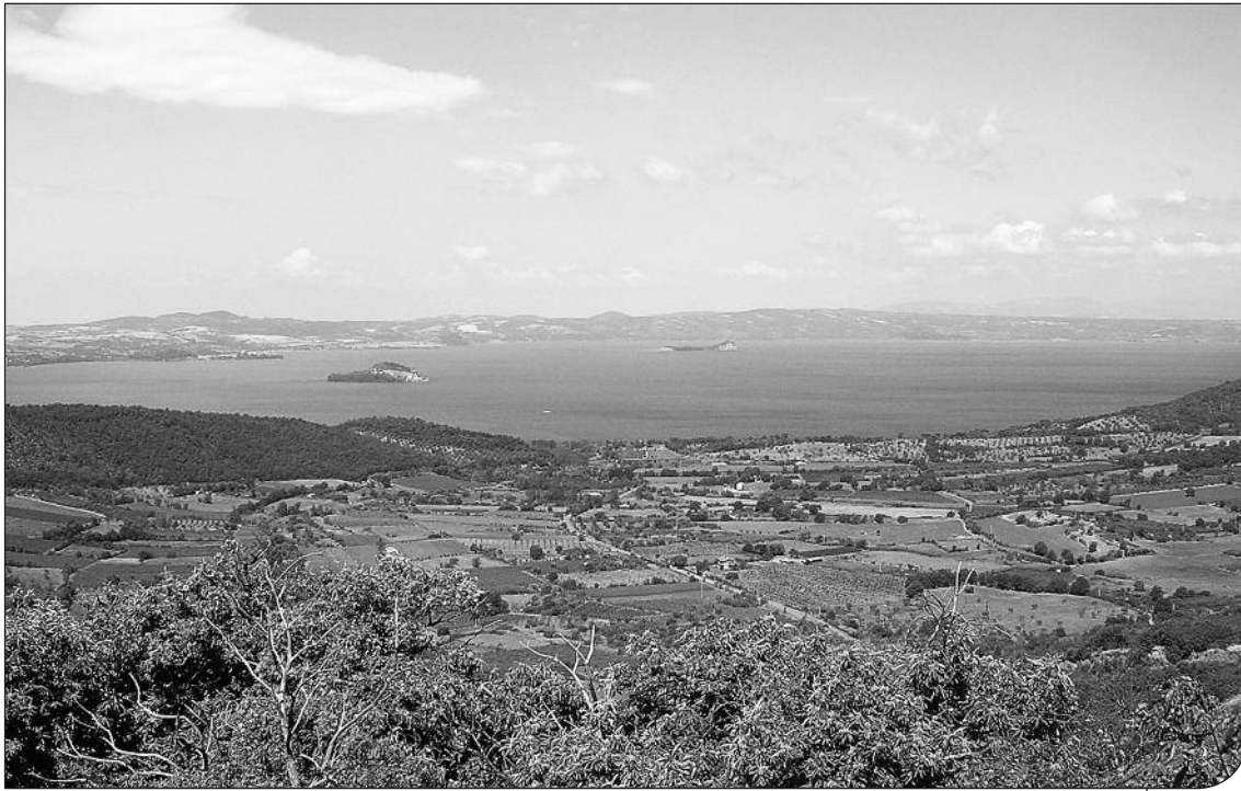
Fig. 1. Immagine del lago di Bolsena.

(IT6010055 – 11.501,40 ha, AA.VV., 2009) disponibile sul sito ufficiale dell'ente ( http://www.provincia.vt.it/Ambiente/natura2000/bolsena.asp ).