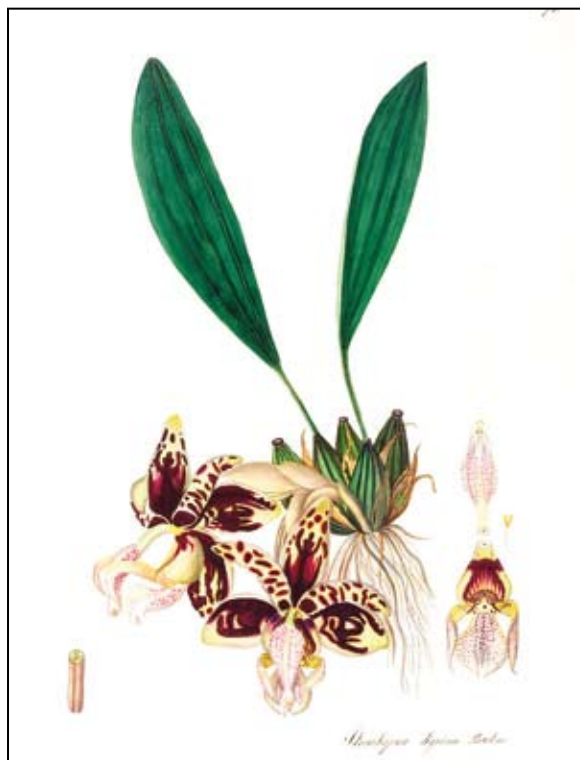
Fig. 3. a) Stanhopea tigrina nella serra "all'olandese". b) acquarello della stessa dipinto da Maddalena Lisa Mussino ( Iconographia taurinensis , Vol. 61 Tav. 78)