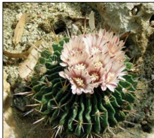
Fig. 4. Serra delle piante succulente. a) esterno. b) Interno. c) Astrophytum myriostigma . d) Mamillaria longimana . e) Stapelia hirsuta . f) Stenocactus pentacanthus .