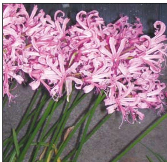
Fig. 5. La "Serra nuova". a) esterno. b) Interno. c) Eucomis autumnalis . d) Haemanthus albiflos . e) Orbea variegata . f) Nerine rosea .