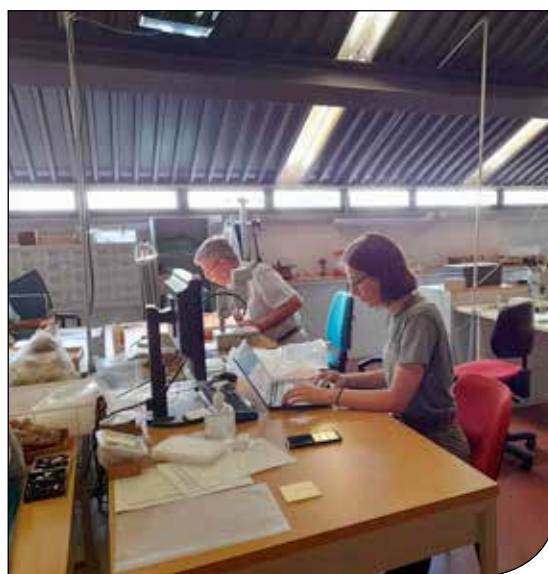
Fig. 3. Lavoro di digitalizzazione per il progetto "Coleotteri dei Colli Berici".

Il progetto si propone di raccogliere le conoscenze relative alle specie dell'ordine Coleoptera presenti nel territorio dei Colli Berici (Vicenza). Tale lavoro, alla sua conclusione, si concretizzerà nella produzione di un volume. La scelta del Museo Naturalistico Archeologico di Vicenza come partner del progetto è dovuta a due considerazioni: il territorio dei Colli Berici è interamente compreso nella provincia di Vicenza e ricade quindi sotto la competenza del Museo; inoltre, alcune collezioni entomologiche, prima di tutto la Collezione Faustino Cussigh, sono lì conservate (v. sito web 11). Il progetto si propone di contribuire alla digitalizzazione, utilizzazione e valorizzazione dei dati contenuti nella collezione (fig. 3).