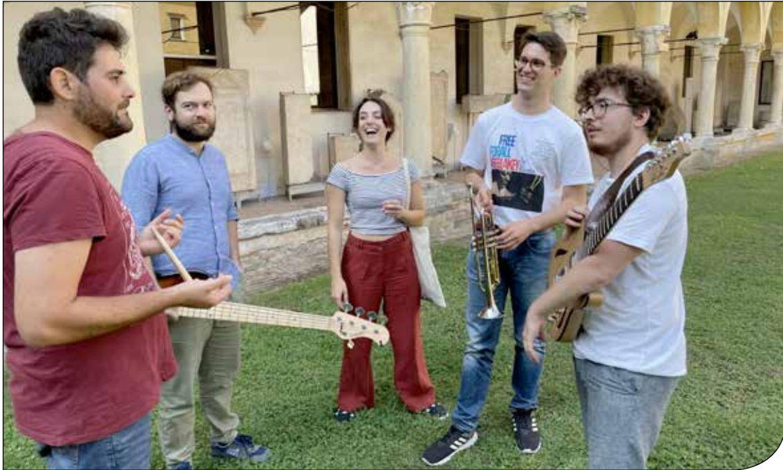
Fig. 2. Gli artisti del progetto "Endangered Species" al Museo.

il paziente nella riappropriazione di una immagine positiva di sé e a guidare i caregiver e i familiari a scoprire e condividere, oltre alle fatiche quotidiane, momenti di gioia, leggerezza e bellezza e a "spostare la propria attenzione" altrimenti focalizzata principalmente sulla malattia. Obiettivi specifici del progetto sono inoltre la prevenzione del linfedema, lo sviluppo della creatività e l'acquisizione di alcune competenze specifiche della danza in quanto arte e del Qi Gong. La possibilità di danzare in luoghi artistici e in luoghi che raccontano il territorio nei suoi aspetti naturalistici e del paesaggio e nella sua stratificazione della storia – che è anche la storia di noi singoli – permette di sperimentare il dialogo con le opere d'arte e con i reperti del MNAV rendendo la danza particolarmente forte e ricca di stimoli, e davvero i partecipanti/protagonisti si sentono pienamente parte della comunità.