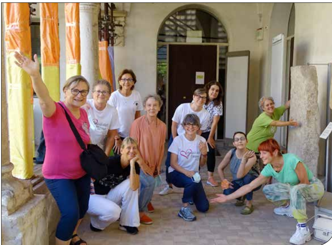
Fig. 1. Una classe di "I Dance the Way I feel" al Museo Naturalistico Archeologico di Vicenza, luglio 2021.