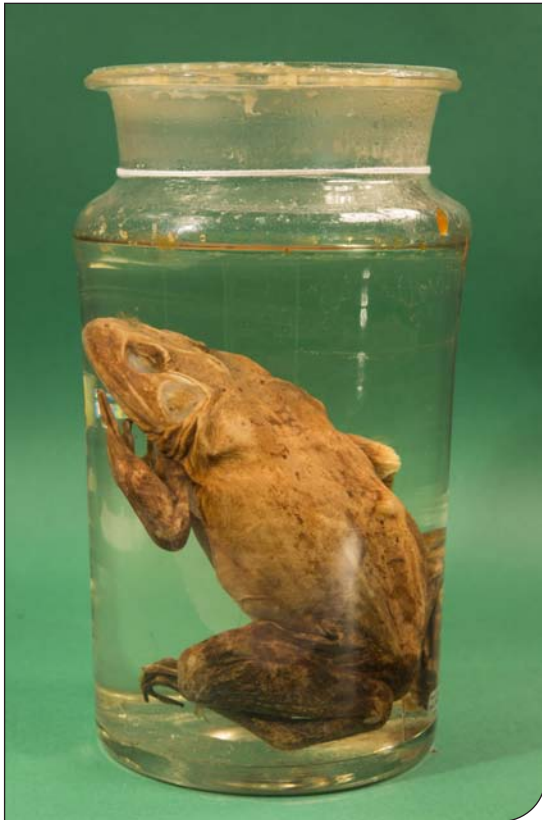
Fig. 2. Esemplare di rana toro ( Lithobates catesbeianus ) conservato in alcol presso il Museo di Storia Naturale dell'Accademia dei Fisiocritici (MUSNAF) di Siena.