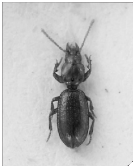
Fig. 2. Alpiodytes peminus (Binaghi, 1936).

Il recupero è stato realizzato mediante un restauro conservativo comprensivo del trasferimento in nuove cassette perché quelle originali, purtroppo, non garantivano più adeguata protezione (fig. 3). È stata realizzata una documentazione fotografica della disposizione originale, mentre ai fini della valorizzazione si è proceduto alla schedatura informatica comprensiva dell'aggiornamento tassonomico.