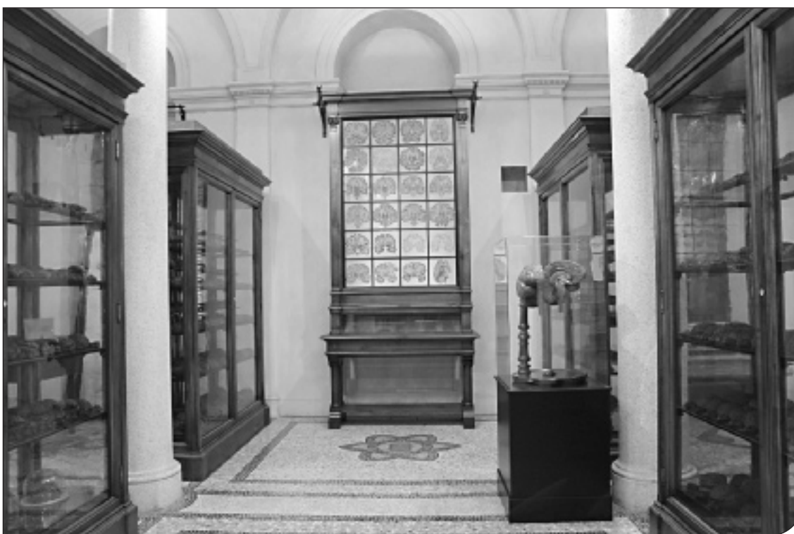
Fig. 5. Museo di Anatomia umana dell'Università di Torino. Nella seconda sala è esposta la vetrina in legno di noce a doppio corpo che evoca l'aspetto di un "altare" con serie di dipinti su vetro di sezioni di encefalo.

detta donna pregnant" ora mancante. Le operazioni di restauro della statua, che era stata ritrovata in uno scantinato in pessimo stato di conservazione, hanno permesso di identificare differenti strati pittorici e di restituire l'opera alla coloritura ottocentesca (in accordo con la Soprintendenza competente non si è portato in risalto la coloritura originaria settecentesca molto lacunosa; Mossetti & Ragusa, 2008).