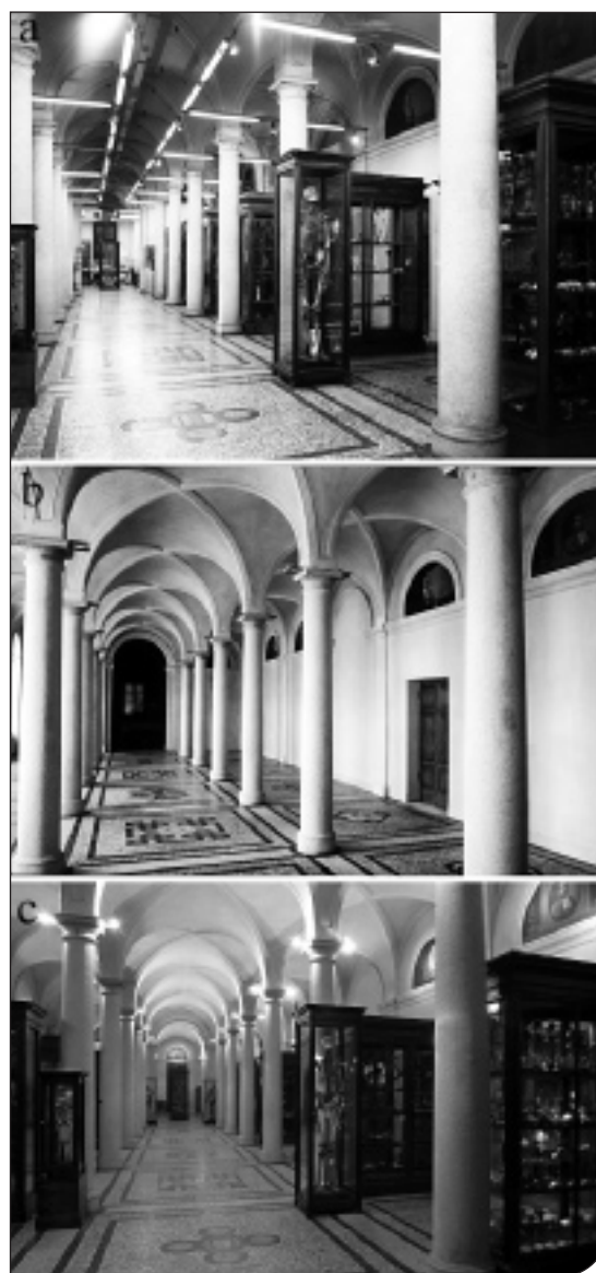
Fig. 1. Museo di Anatomia umana dell'Università di Torino. Immagini della sala principale del museo prima (a) e dopo il restauro (c); b) immagine della stessa sala dopo il restauro dell'ambiente e prima del riallestimento.

Una saggio stratigrafico condotto sulle superfici di volte e pareti ha permesso di evidenziare che il colore presente era ancora quello originario. Esso presentava degni di degrado a seguito di infiltrazioni di acqua dai locali del sottotetto (che avevano anche portato, in alcuni tratti, a fioriture di sali minerali) e forti depositi di sporco superficiale. Le operazioni condotte sono