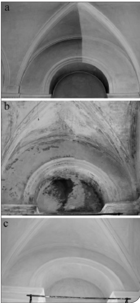
Fig. 2. Museo di Anatomia umana dell'Università di Torino; a) saggio di pulizia a secco su volta ben conservata; b) volta in cattive condizioni di conservazione; c) volta rappresentata in b dopo l'intervento di restauro.

I serramenti del museo, interamente realizzati in legno di noce, presentavano classici problemi legati alla vetustà dei manufatti e alla mancanza di adeguata manutenzione nel corso del tempo (cedimenti strutturali, fessurazioni, ...). Le operazioni di restauro (effettuate in seguito alla rimozione dei vetri d'epoca) hanno spaziato da interventi ebanistici a interventi di pulizia, a trattamenti conservativi fino al recupero della coloritura interna ed esterna. I vetri d'epoca sono stati rimossi e ripuliti da stucature al silicone (effettuate negli ultimi venti anni) e riposizionati nei telai lignei con spessori e viti come in origine. Nei casi di lastre fratturate si è provveduto alla sostituzione con vetri "tirati" anticati.