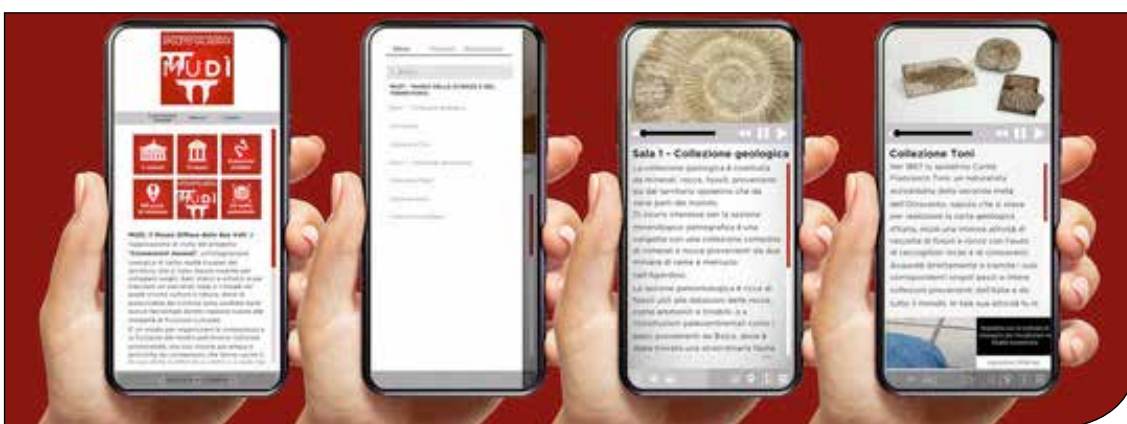
Fig. 13. Alcune schermate dell'app Mudi.

Sono state portate avanti anche attività legate all'alternanza scuola-lavoro (costruzione di simulatori di faglie, catalogazione di pezzi della Collezione Toni). Inoltre sono stati organizzati eventi aperti alla popolazione a cadenza annuale, come quelli legati alla Giornata delle Miniere, alla Settimana del Pianeta Terra, alla Notte dei Ricercatori, al Save The Frogs Day, alla Bat Night, e sono state fatte delle escursioni legate al Piano Scuola Estate 2021 (fig. 12). E infine è stata allestita una mostra provvisoria con i migliori pezzi della Collezione Ragni, con numeri importanti di visitatori fino alla chiusura imposta dalla pandemia. La mostra nell'estate del 2020 si è arricchita dei migliori pezzi della Collezione Toni, ma poi ha subito come tutte le realtà museali la nuova chiusura dovuta alla rinnovata emergenza sanitaria. Nei mesi autunnali e invernali e a inizio primavera si è cercato di sopperire a questa forzata chiusura con una serie di eventi online e di attività online con le scuole, per poi riaprire i fine settimana da giugno. Durante questo periodo è stata sviluppata un'app, Mudi Connessioni museali, con contenuti di realtà aumentata (AR), per i musei di Spoleto e della Valnerina, che permette la visita turistica in autonomia dei musei e di percorsi urbani, grazie all'utilizzo di sensori bluetooth e GPS (fig. 13). La mostra temporanea è una delle strutture visitabili in questo modo, trovan-