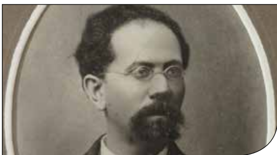
Fig. 1. Il conte Francesco Toni, naturalista e collezionista spoletino dell'Ottocento.