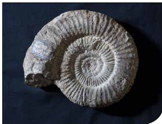
Fig. 3. Uno degli esemplari più belli di ammoniti della Collezione Toni.