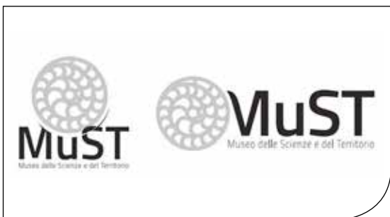
Fig. 7. Il nuovo logo del MuST, in cui il disegno schematico di un foraminifero richiama il rosone del duomo di Spoleto.