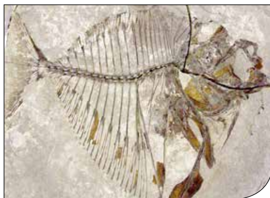
Fig. 5. Pesce proveniente dal sito fossilifero di Bolca.