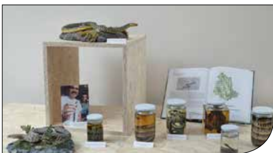
Fig. 10. Alcuni dei rettili conservati nella Collezione Ragni.

La nuova gestione ha contribuito all'elaborazione del progetto che ha portato in primo luogo al cambiamento del nome in Museo delle Scienze e del Territorio, alla elaborazione del nuovo logo (fig. 7) e alla ristrutturazione dei locali.