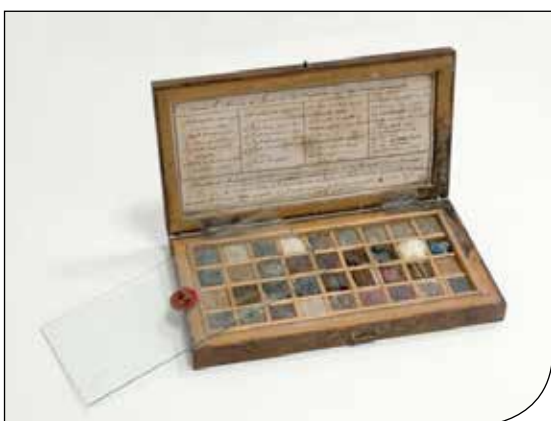
Fig. 2. Valigetta originale con una collezione completa di minerali e rocce dell'Agordino.