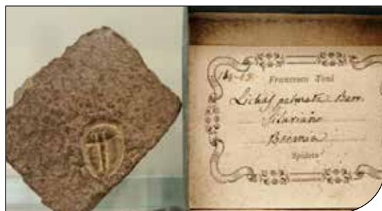
Fig. 4. Trilobite e cartellino originale vergato dal conte Toni.

La sezione paleontologica è ricca di fossili utili alla datazione delle rocce, come ammoniti (fig. 3) e trilobiti (fig. 4), o a ricostruzioni paleoambientali, come i pesci provenienti da Bolca, dove è stata trovata una straordinaria fauna marina tropicale risalente a circa 50 milioni di anni fa (fig. 5). Molto interessante anche la collezione di fossili di mammiferi che testimoniano le faune esotiche che vivevano in Italia da circa 3 milioni di anni fa a qualche decina di migliaia di anni fa. L'Umbria è molto ricca di ritrovamenti di elefanti, rinoceronti, ippopotami risalenti al Pleistocene, ma a Spoleto e in particolare nella miniera di lignite di Morgnano sono stati trovati i mammiferi più antichi dell'Umbria (mastodonti e tapiri) (fig. 6).