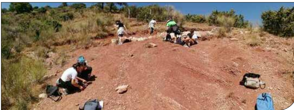
Fig. 12. Attività di Scuola Estate 2021: ricerca di ammoniti nel detrito di Rosso Ammonitico.