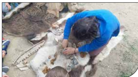
Fig. 11. Attività di "museo nella scuola": vita quotidiana nella preistoria.

Il Laboratorio prima e il MuST poi, tra il 2017 e il 2019, fino al duro impatto della pandemia sulle attività, hanno svolto azioni che hanno rinsaldato il legame con il territorio, con una pratica di "museo nelle scuole" (fig. 11): in buona sostanza, essendo il laboratorio non in condizione di essere visitato appieno e in sicurezza, si è proceduto al trasferimento delle attività e dei materiali direttamente nelle scuole che ne hanno fatto richiesta, con numeri progressivamente via via più importanti.