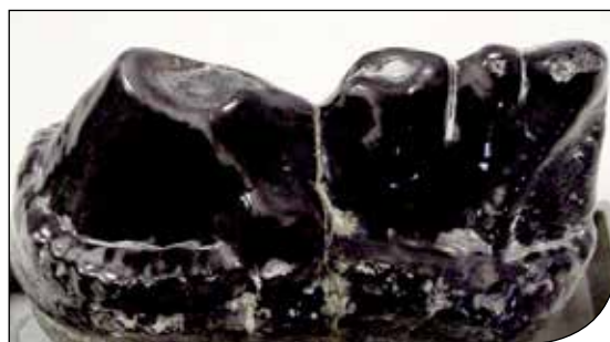
Fig. 6. Molare di Mastodon borsoni proveniente dalla miniera di lignite di Morgnano.