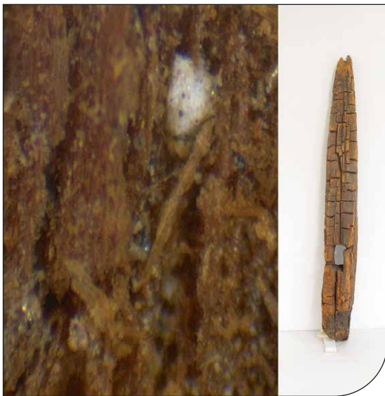
Fig. 2. Osservazione allo stereomicroscopio di un particolare di materiale campionato dal palo 3299. È visibile un'abbondante formazione cristallina sulla superficie lignea e tra le fibre.