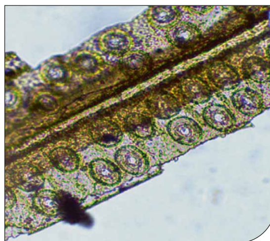
Fig. 1. Particolare di una fettina di legno di larice (trave 3311a), osservata al microscopio ottico (200x) in sezione longitudinale. È visibile un'ifa fungina che corre lungo la parete della tracheide.

In conclusione, ciascuno dei reperti analizzati presentava danni riconducibili a colonizzazioni di funghi da carie bruna, appartenenti alla divisione Basidiomycota (Basso, 2023). Il materiale legnoso appariva microfessurato, sfibrato e fragile, anche se non in totale disfacimento: come detto sopra, sono tutte manifestazioni del deterioramento della cellulosa, ma non della lignina, compiuto dai funghi xilofagi detti della carie bruna o "cubica".